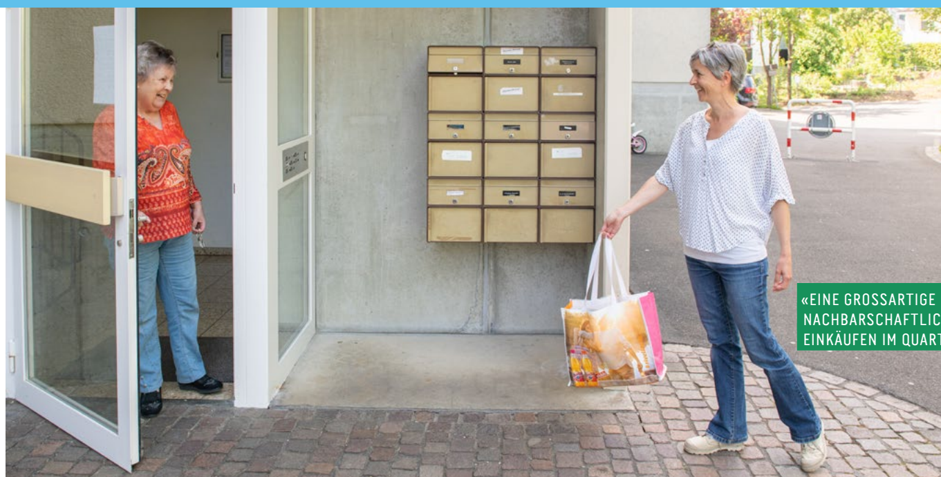
«EINE GROSSARTIGE HILFE!» NACHBARSCHAFTLICHES EINKÄUFEN IM QUARTIER.