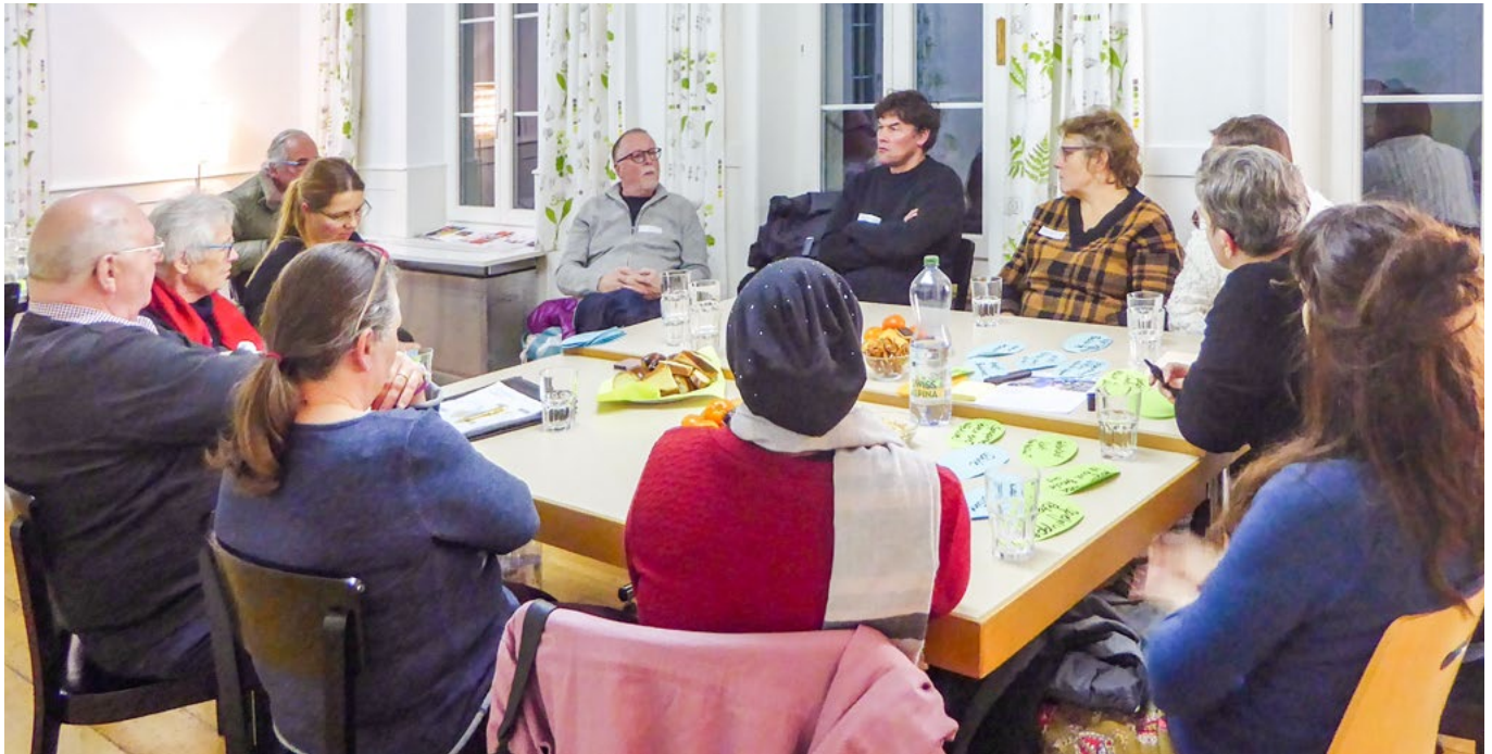
Tischgespräch im Quartier «Feld», Nachbarschaftshaus Bachstrasse, im Januar 2020.

Die Quartierentwicklung Suhr hat von Oktober 2019 bis Februar 2020 in vier Quartieren in Suhr Tischgespräche durchgeführt, um die Anliegen, Wünsche und Ideen der Bevölkerung aufzunehmen und zu diskutieren. An den Gesprächen haben jeweils auch die Leiterin der Abteilung Gesellschaft und ein Mitglied des Gemeinderates teilgenommen.