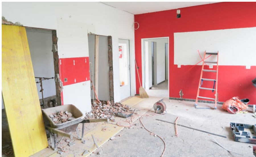
Nach dem Umbau finden vielseitige Angebote und Projekte im Nachbarschaftshaus ihr neues Zuhause.

Neben dem Nachbarschaftshaus ist die Quartierentwicklung auch weiterhin daran, die Entwicklungen im Quartier zu begleiten. So werden voraussichtlich ab Frühsommer 2020 die Gebäude im Frohdörfli saniert. Dabei soll auch der Aussenraum neu gestaltet werden. Die Quartierentwicklung versucht, die Anwohnenden bei der Wohnumfeldgestaltung miteinzubeziehen und die Mitwirkung in Zusammenarbeit mit den Liegenschaftsbesitzenden zu ermöglichen. So sind beispielsweise mehrere Hochbeete wie auch ein Ort zum Fussballspielen für die Kinder geplant. Bereits umgezogen sind die Schrebergärten im Quartier. Es ist lebendig rund um den Schützenweg.