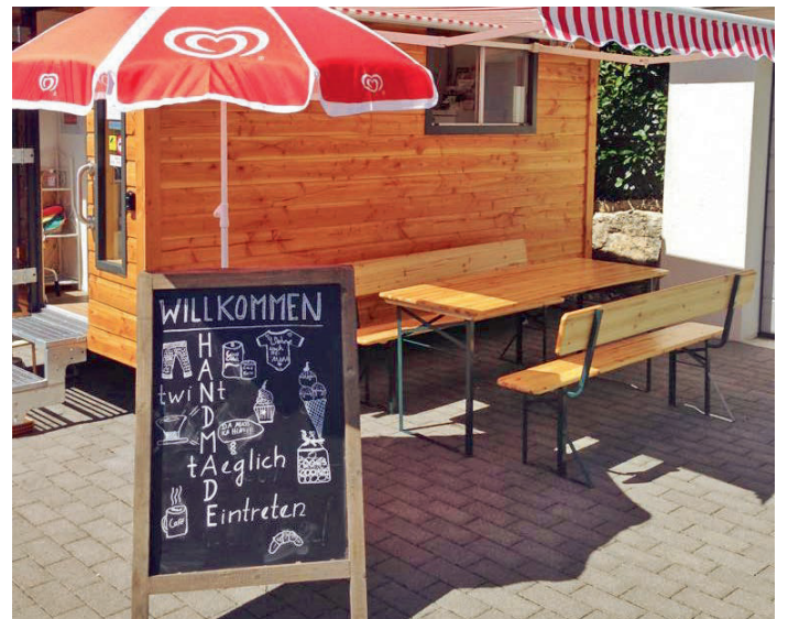
Abwechslung auf dem Spaziergang bietet das Zirkuswagen-Lädli.